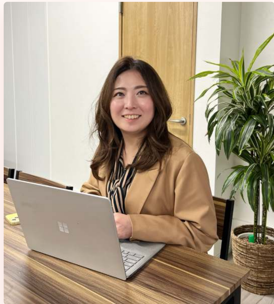
— SCENE — CHIEF INSTRUCTOR 日本一、諦めの悪い行政書士